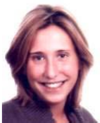
DOR Virginie Belgique