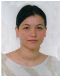
BURIMI Arta Albanie