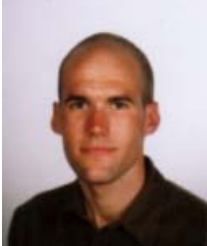
SAVER Jan Belgique