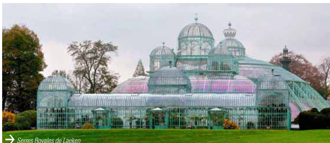
→ Serres Royales de Laeken