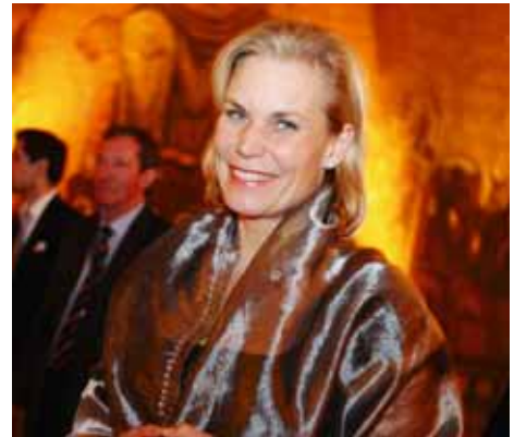
Minister for Development Cooperation Sweden Gunilla CARLSSON

While Sweden is holding the Presidency of the Council of the European Union this autumn, the world is affected by the global economic crises and at the same time, faces the challenge of the climate change. The Swedish Presidency's vision is a strong and effective Europe where focus is on the common responsibility to meet the challenges of today and tomorrow. The Swedish Presidency is anxious to ensure that developing countries can effectively fight poverty in all its forms and meet the challenges that follow in the wake of the global economic crisis and climate change that are decisive issues for the future. I myself had the privilege to chair the Commission on Climate Change and Development whose conclusions provide an important contribution to the work to integrate climate adaptation into development cooperation and with a view to the climate meeting in Copenhagen.