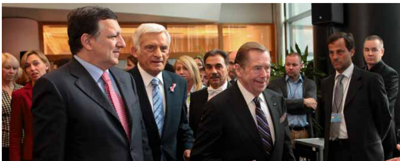
→ Vaclav Havel aux côtés de José-Manuel Barroso et de Jerzy Buzek, nouveau président du PE.

Excerpts from Vaclav Havel's speech at the European Parliament, Brussels - 11 November 2009