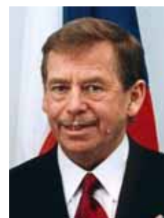
former President of the Czech Republic Vaclav HAVEL

"Our support can help open-minded people or outspoken witnesses to the situation in North Korea, Burma, Iran, Tibet, Belarus, Cuba or anywhere else, much more than we think."