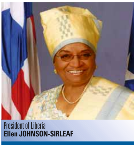
President of Liberia Ellen JOHNSON-SIRLEAF

Ellen JOHNSON-SIRLEAF, Africa's first female Head of state, contributed tirelessly and in an exceptional fashion to the success of European Development Days 2009 which was held last October in Stockholm and was co-organised by the Commission and the Swedish Presidency. From plenary sessions to a flurry of workshops, the President of Liberia kept on hammering her convincing and pragmatic messages.