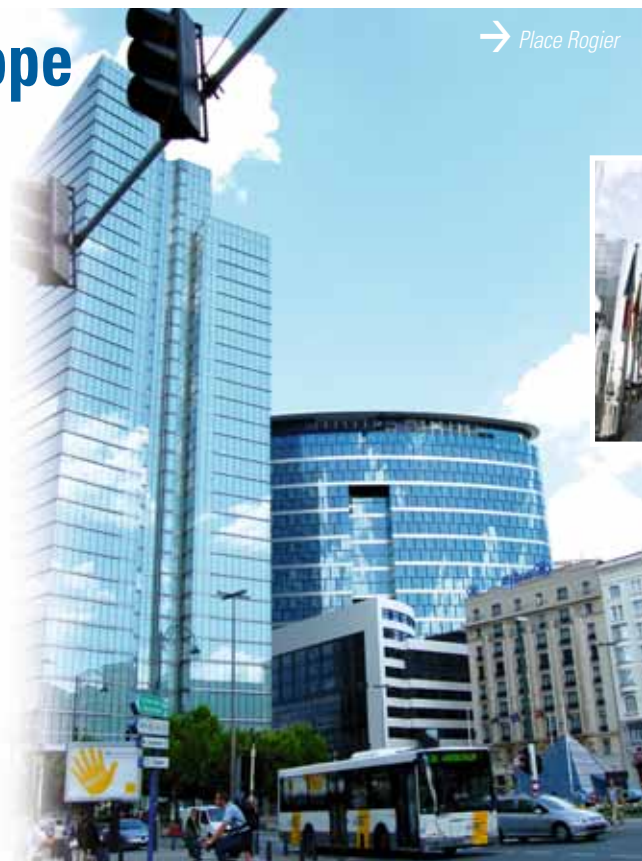
→ Place Rogier

Bruxelles s'est donc «européanisée». On estime que 30% de la population de la ville est d'origine étrangère, soit autant que Londres. Une population qui ne se trouve cependant pas toujours sur le sol bruxellois, puisqu'elle est particulièrement mobile, contrairement à son homologue anglaise.