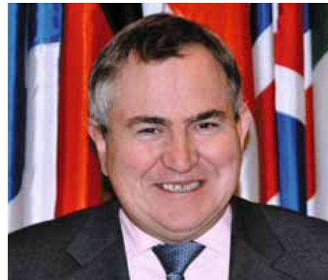
MP (United Kingdom), President of the European Security and Defence Assembly (ESDA) Robert WALTER

As good Europeans we hope and pray that our foreign policy objectives are not in conflict. In fact we devote a considerable amount of time and effort to arriving at common positions. We earnestly wish those common positions should be common European positions.