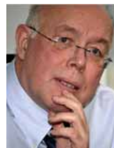
Ministre-Président du Gouvernement de la Région de Bruxelles-Capitale Charles PICQUÉ

La capitale de la Belgique profite des retombées économiques liées à ses activités européennes, et notamment dans le secteur tertiaire. Un dynamisme qu'il faut toutefois relativiser car il existe de fortes disparités territoriales et un taux de chômage très élevé.