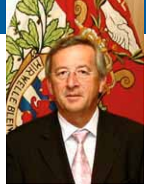
Prime Minister of Luxembourg, President of the Eurogroup* Jean-Claude JUNCKER