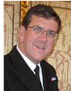
Commander of the operation ATALANTA Rear Admiral Peter HUDSON

The prosecution of captured suspects proved to be a stumbling block in the earliest days of counter-piracy operations off Somalia. The complexities involved in bringing suspects back to Europe for trial and incarceration has led to the development of a legal framework with Kenya, allowing prosecution through the Kenyan judicial system. Inaugurated by an exchange of letters between the EU and Kenya on 6 March 2009, this arrangement allows suspects captured by EU vessels to be transferred to Mombassa for trial. To develop the capability and improve the standards of the Kenya judicial system, a financial assistance has been developed by the European Commission. The EU has concluded with the Republic of Seychelles the same kind of agreement on 30 October 2009.