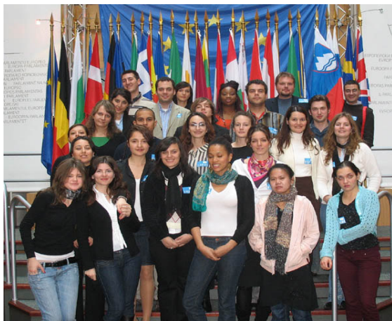
Anciens des promos 2007/ 2008, bienvenue au Club !